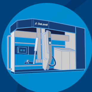
DeLaval VMS V300

Wir liefern Lösungen, die Ihnen helfen, mehr und bessere Qualitätsmilch mit gesünderen Tieren zu produzieren.