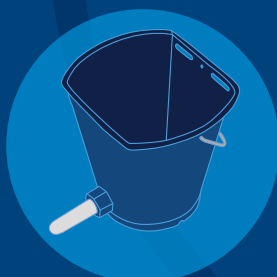
DeLaval Milchränker mit Sauger

Deshalb beschränken wir uns nicht auf einen bestimmten Teil des Milchproduktionsprozesses. Wir entwickeln, produzieren, installieren und warten ganze Systeme und kümmern uns um Qualität und Zuverlässigkeit jeder Komponente in diesen Systemen.